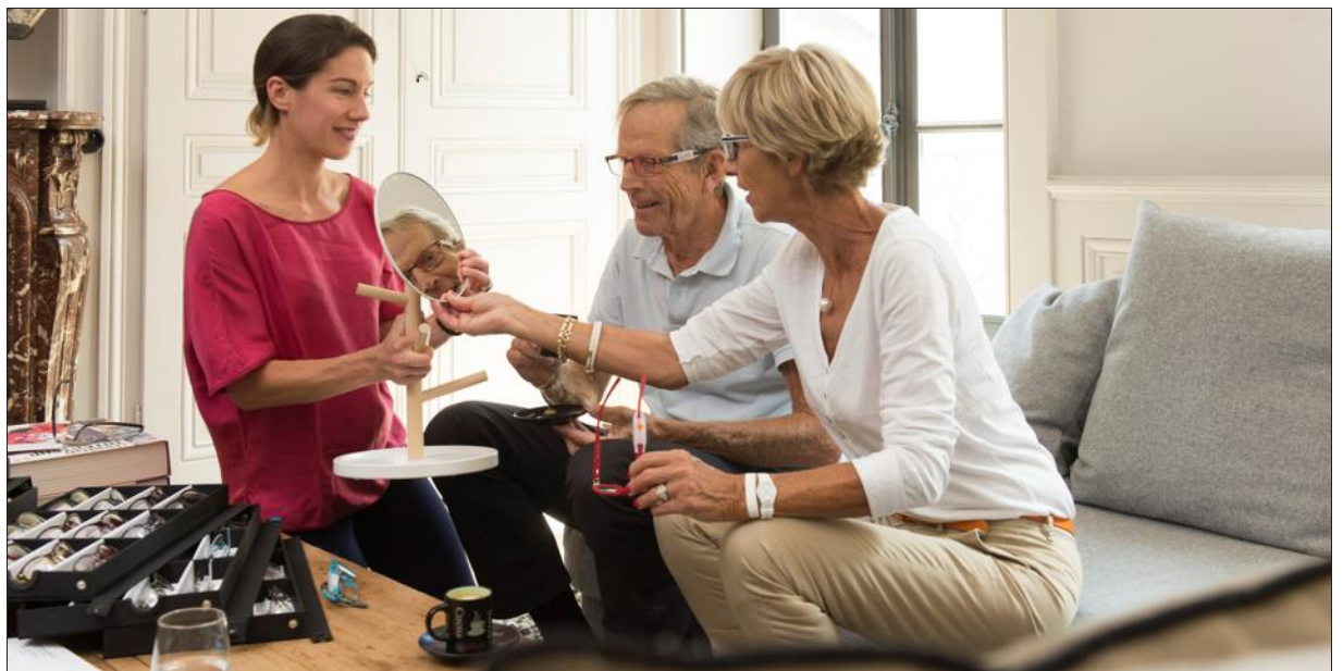
■ « Le domicile a un petit côté luxe, confort ».