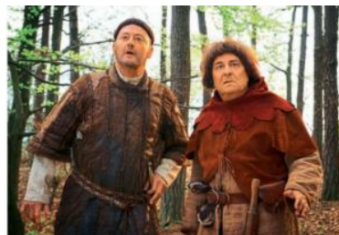
Jean Reno et Christian Clavier bientôt sous la Terreur.

Gare ! Godefroy de Montmirail et son fidèle écuyer Jacquouille la Fripouille sont de retour. Dans ce troisième volet, sur les écrans au printemps 2016, nos duettistes médiévaux vont être plongés en pleine Révolution française. Qui plus est, dans sa période la plus sombre : la Terreur. Ils vont devoir aider les descendants de Godefroy à échapper à l'échafaud. Protagonistes de l'aventure dès son origine en 1993, Jean Reno et Christian Clavier tiennent une nouvelle fois les rôles principaux. On ne change pas une équipe qui gagne ! J.-C. M.